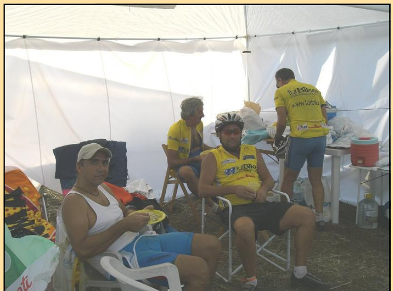
Il Quartier Generale Turbike alla 24h MTB